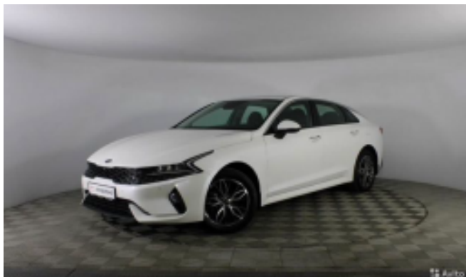
Фотография от 24 августа 2021 года

Есть ещё 33 фотографий автомобиля Посмотреть фотографии на сайте